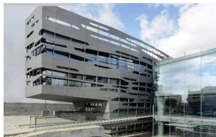
ABDOUN FASHION ATRIUM, AMMAN (JORDANIE) AGENCE D'ARCHITECTURE SYMBIOSIS DESIGNS LTD