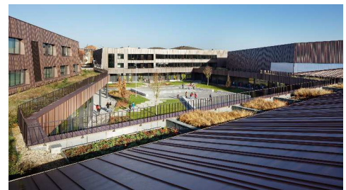
COLLÈGE MOULINS, LILLE (FRANCE) AGENCES D'ARCHITECTURE CHARTIER DALIX ARCHITECTES CO-TRAITANT AVANTPROPOS ARCHITECTES