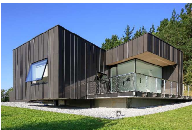
CASA GOLF, HONDARRIBIA (ESPAGNE) AGENCE D'ARCHITECTURE REHABITE

Treize ans après sa création, l'engouement pour ce prix d'architecture ne se dément pas. En témoigne cette dernière édition qui a recueilli plus de 150 projets, provenant de 18 pays. Son Jury, composé d'experts internationaux de l'architecture et du bâtiment, a récompensé 9 Prix dans les catégories Habitat Individuel, Habitat Collectif, Lieux d'Entreprise et Équipements Publics, et 3 Prix Spéciaux (Construction Durable, Prix des internautes et Grand Prix du Jury) . Plus que des réalisations, ils ont primé des projets complets, qui allient qualité architecturale, intégration réussie dans l'environnement, usage créatif du zinc et fonctionnalité de l'ouvrage.